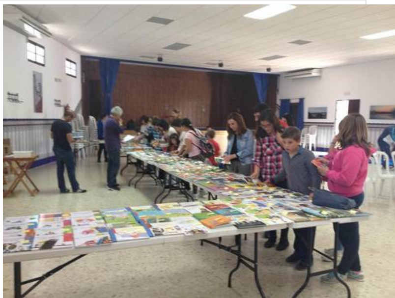
( http://www.beturia.es/export/sites/beturia/es/.galleries/imagenes-noticias/Noticias-2015/872df1e233.jpg )