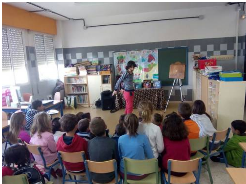
( http://www.beturia.es/export/sites/beturia/es/.galleries/imagenes-noticias/Noticias-2015/61dfce7e6b.jpg )