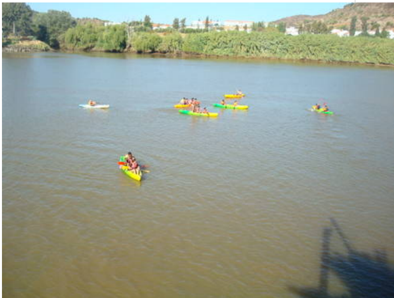
( http://www.beturia.es/export/sites/beturia/es/proyectos-y-actividades/tag/.galleries/noticias-tag/2012-09-17-II-Campus-Deportivo-Beturia3.jpg )