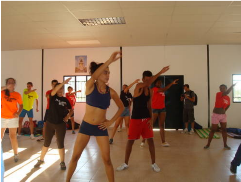
( http://www.beturia.es/export/sites/beturia/es/proyectos-y-actividades/tag/.galleries/noticias-tag/2012-09-17-II-Campus-Deportivo-Beturia2.jpg )