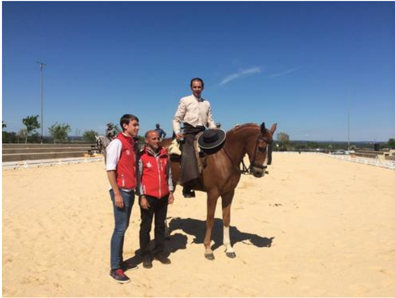
( http://www.beturia.es/export/sites/beturia/es/.galleries/imagenes-noticias/Noticias-2015/bd9f7fbe69.jpg )