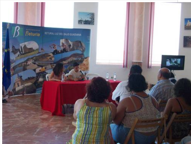
( http://www.beturia.es/export/sites/beturia/es/.galleries/imagenes-noticias/Noticias-2014/64b7f23a4c.jpg )