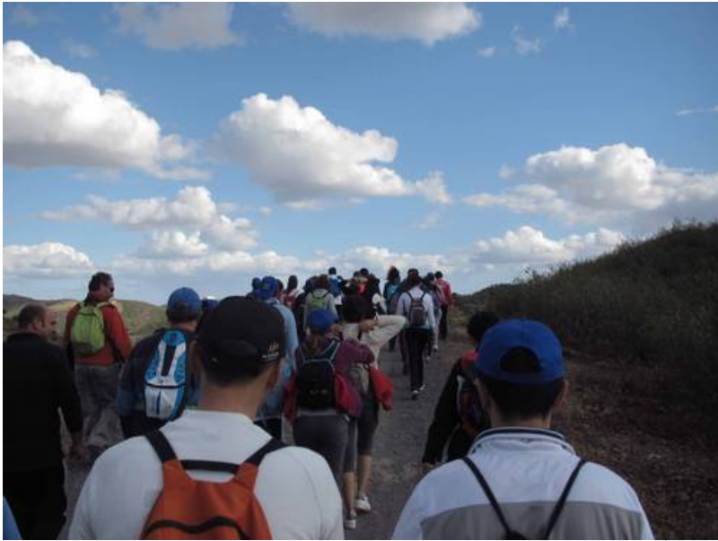
( http://www.beturia.es/export/sites/beturia/es/proyectos-y-actividades/tag/.galleries/noticias-tag/2013-05-20-Ruta-Redescubre-el-Guadiana2.jpg )