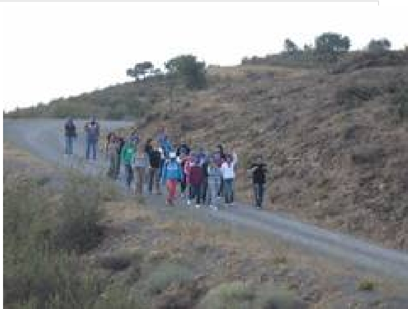
( http://www.beturia.es/export/sites/beturia/es/proyectos-y-actividades/tag/.galleries/noticias-tag/2013-05-20-Ruta-Redescubre-el-Guadiana3.jpg )