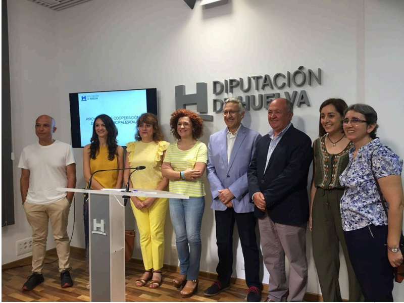
( http://www.beturia.es/export/sites/beturia/es/.galleries/imagenes-eventos/36889864_2095777093829149_2806336317015719936_n.jpg )